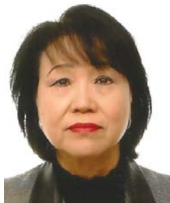
Kikuko Atarashi Okazumi Presidenta